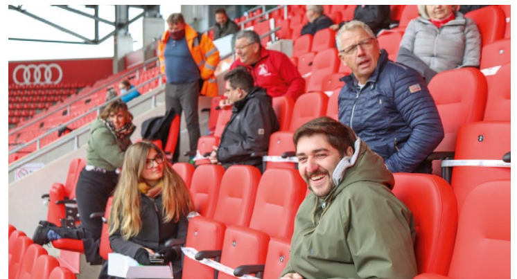
Impressionen von der mit »Abstand« außergewöhnlichsten Delegiertenversammlung der IG Metall Augsburg im Audi Sportpark