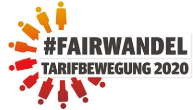
Tarifiergebnis 2020 für Textile Dienste (Übersicht)

News zur Tarifrunde 2020 Das IG Metall-Zukunftspaket: Bewegung statt Stillstand!