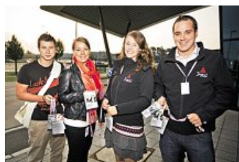
Die JAV ist die Anlaufstelle für die Jugendlichen.

Ausbildungsstart bei Cassidian in Manching.