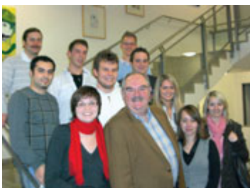
Stippvisite bei der Jugend.