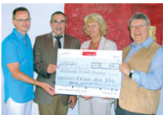
Scheckübergabe bei Zorn