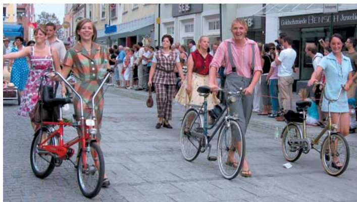
Jugend anno 1969

»Im VW Käfer steckt viel Blut und Schweiß und Ingolstädter Arbeitsfleiß«, mit diesem Slogan starteten die rund 70 IG Metallerrinnen und Metaller am 23. Juli in den historischen Festzug zur 1200-Jahr-Feier der Stadt Ingolstadt.