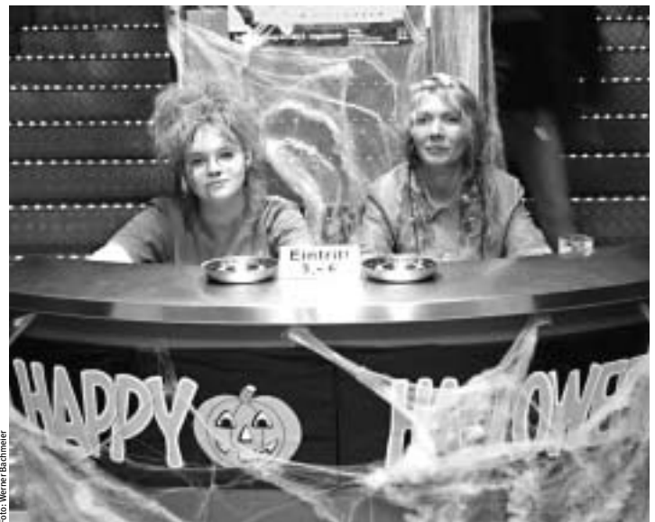
Ein grusliger Empfang

Seit November 2002 laufen hierzu die ersten Gespräche. Von genauso herausragender Bedeutung ist die Entscheidung mittel- und langfristig in die technischen Voraussetzungen zu investieren, damit an den beiden Standorten Neckarsulm und Ingolstadt zukünftig alle Audi-Modelle produziert werden können. Die Perspektive einer »Dreh-scheibe« zwischen Ingolstadt und Neckarsulm ist damit wesentliche Voraussetzung zur langfristigen Sicherung der Arbeitsplätze.