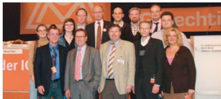
Unsere Delegierten und Teilnehmer am Gewerkschaftstag.