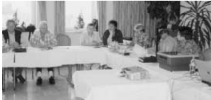
Gedankenaustausch der Senioren aus Gera und Ingolstadt

in Altenburg stand die außerbetriebliche Gewerkschaftsarbeit und die Betreuung der Arbeitslosen und Senioren im Mittelpunkt.