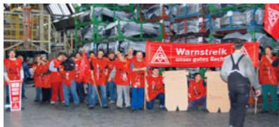
Die Textiler zeigten sich selbstbewusst in der Tarifrunde.

»Dies ist in der schwierigen Zeit ein wichtiger Beitrag zur Stärkung der unteren Lohngruppen. Das Geld soll da ankommen, wo es am meisten gebraucht wird.«