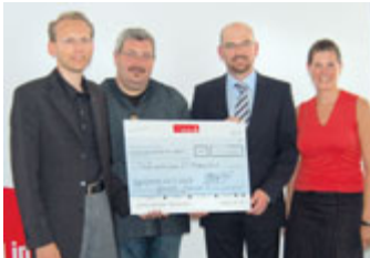
Scheckübergabe bei EADS

Im Rahmen der Fragebogenaktion »Gemeinsam für ein gutes Leben« gab es die Möglichkeit, der betriebsbezogenen Auswertung der zurückgegebenen Bögen. Je nach Anzahl der Rückläufer spendeten die Metaller aus den Firmen EADS in Manching, Wacker Neuson SE in Reichertshofen und Zorn in Aichach für ihre ausgewählten sozialen Vereine. So wählten die Metallerrinnen und Metaller von EADS die »Straßenambulanz St. Franziskus«, von Wacker Neuson SE den »Förderkreis krebskranker Kinder«, der Firma Zorn die »Lebenshilfe Aichach-Friedberg« und von Osram das »Kinderdorf Marienstein«.