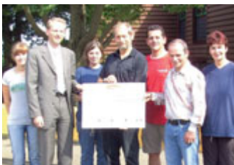
Scheckübergabe bei Osram

FRAGEBOGENAKTION VON »GEMEINSAM FÜR EIN GUTES LEBEN« EIN ERFOLG!