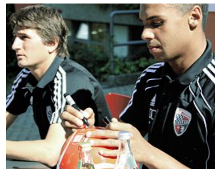
Rote Karte gegen Ungerechtigkeit