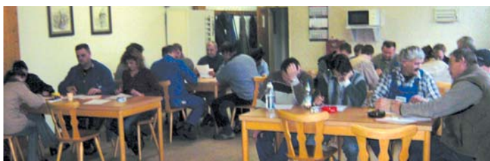
Deine Meinung ist gefragt: Fragebogenaktion bei Grünwald Neuburg