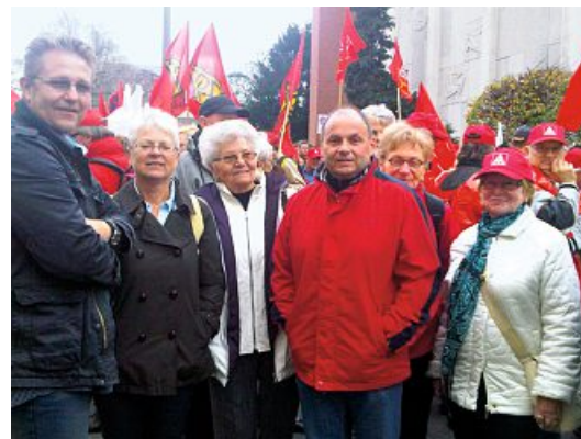
Die Metaller stehen für ihre Forderung ein.