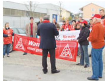
Klein, aber oho: hohe Warnstreikbeteiligung bei Sumitomo in Hepberg.