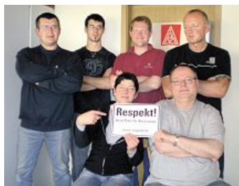
»Respekt!« wollen die Betriebsräte bei Firma Biersack in Beilngries.

Internet: ▶ www.igmetall-ingolstadt.de Redaktion: Johann Horn (verantwortlich), Ursula Enzenberger, Anja Brecht