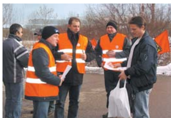
Heiße Diskussion bei kalter Witterung – Aktion bei Faurecia Neuburg