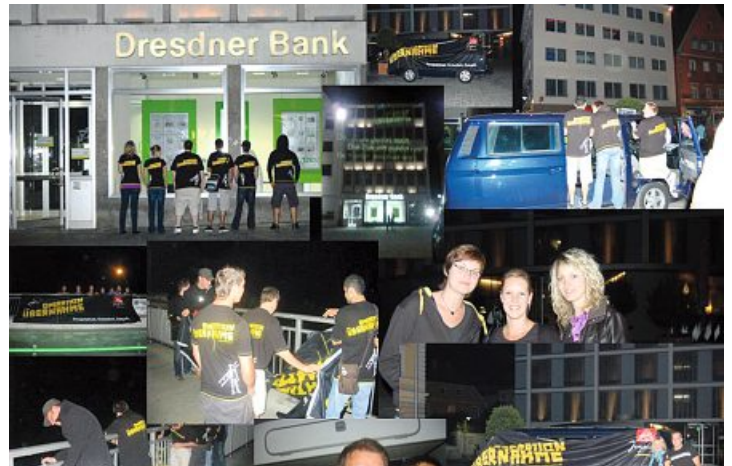
Mit ihren Guerilla-Aktionen für bessere Übernahmebedingungen in den Betrieben machte die IG Metall-Jugend mobil.