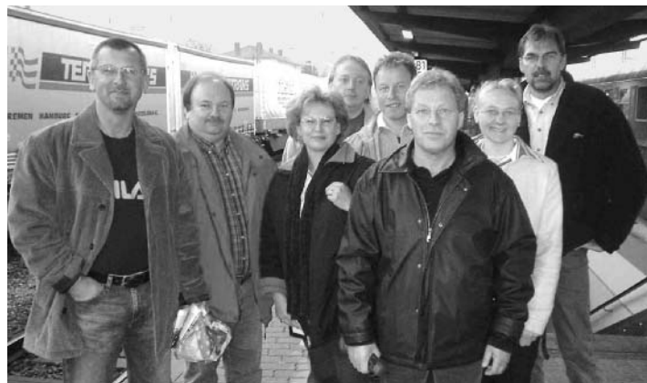
Aktionstag des Kfz-Handwerkes in Göttingen: engagierte Betriebsräte aus Kfz-Betrieben in Ingolstadt

Fälle aus. Wer noch vor Ablauf der Tarifverträge Mitglied der IG Metall wird, erlangt noch den Schutz des Tarifvertrags. Beschäftigte, die erst nach dem Ende des Tarifvertrags neu eingestellt werden, kommen nach der Rechtsprechung des Bundesarbeitsgerichtes dagegen nicht mehr in den Genuss der Nachwirkung. Nähere Infos über das Betriebsratsbüro oder die IG Metall.