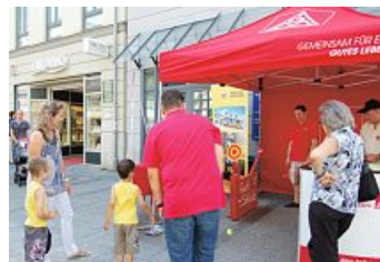
Kinder an der Gummibärenschleuder des Aktionszeltes der Fa. Wacker Neuson SE