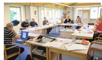
Diskussion der Angestellten

Die Angestellten in der IG Metall Ingolstadt werden die Debatte führen und arbeiteten dies in ihr Arbeitsprogramm ein. ■