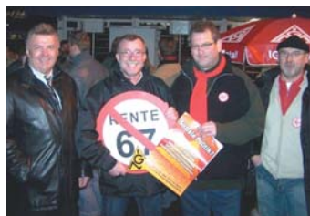
Mit Kaffee und Kuchen gegen Rente mit 67 – Toraktion bei EADS Manching