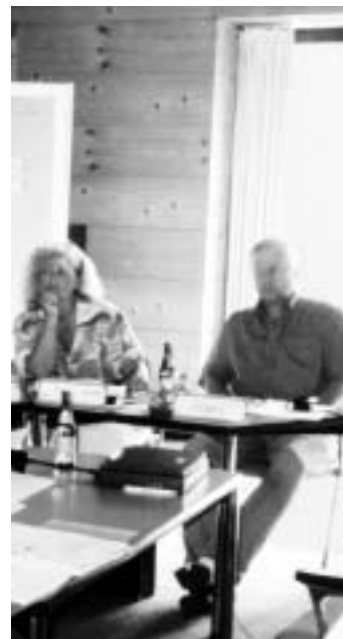
Seminar der Vertrauenskörperleiter in Inzell