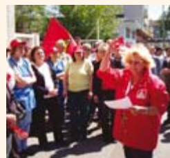
Das haben die Arbeitgeber gespürt: Die Belegschaften standen voll hinter den Tarifforderungen der IG Metall