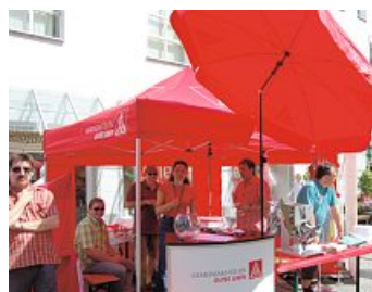
Aktionszelt der Fa. Rieter GmbH mit Ballwurf