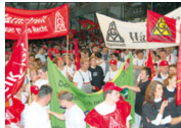
Weitere 10 000 Beschäftigte beim zweiten Warnstreiktag bei Audi.