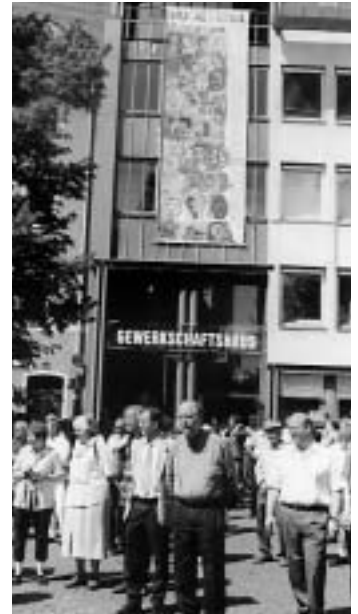
Das Gewerkschaftshaus mit einem Transparent zur Kundgebung gegen die Jungen Nationaldemokraten