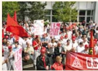
Über 12000 Kolleginnen und Kollegen beteiligten sich bei Audi Ingolstadt am Warnstreik

Hinzu kommen noch zwei Einmalzahlungen. Die erste mit 400 Euro für die Monate April