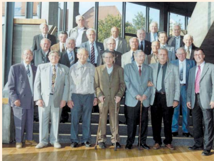
Gewerkschafter der ersten Stunde