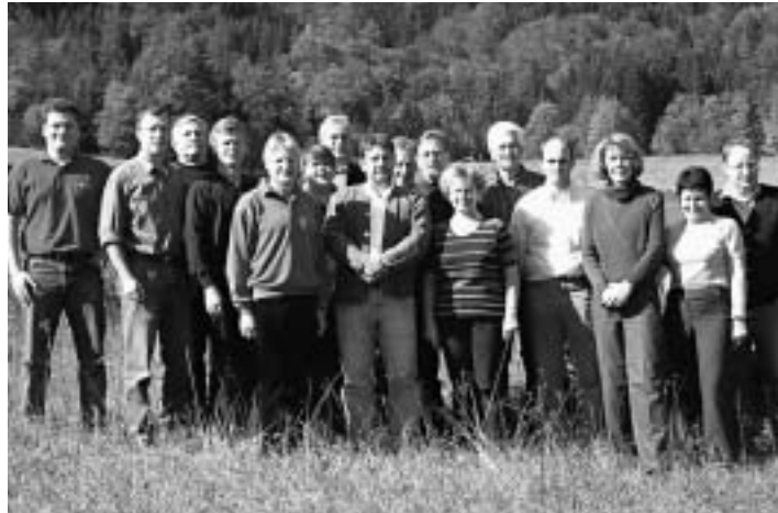
Die Teilnehmer der Ortsvorstandsklausur in Inzell