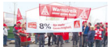
90 Streikende bei Cummins entrüstet über das Liliput-Angebot der Arbeitgeber.