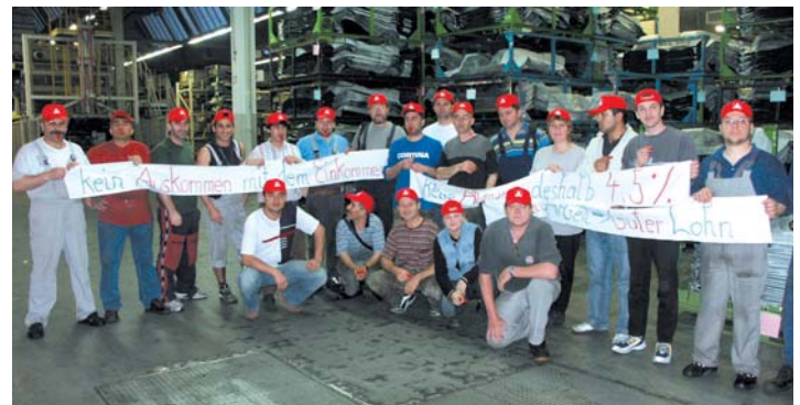
Textiler im Warnstreik

Über 600 Beschäftigte der Faurecia in Neuburg und Ideal Ingolstadt äußerten ihren Unmut über das unverschämte Arbeitgeberangebot und legten die Arbeit nieder.