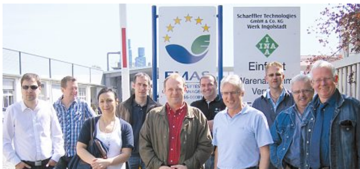
Betriebsräte lernen praxisnah bei Schaeffler (l.o.) und Osram (r.u.) damit sie ihre Kolleginnen und Kollegen im Betrieb in Entgeltfragen kompetent beraten können.

Großes Interesse. Nachdem sich an der Auftaktveranstaltung im