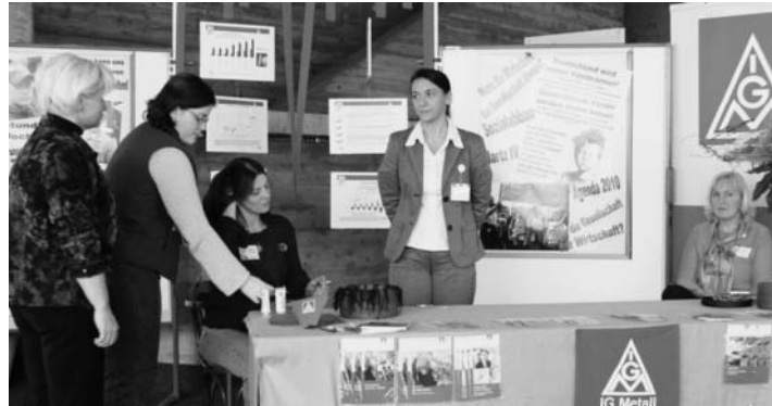
8. März Internationaler Frauentag

Der Internationale Frauentag ist ein Tag, an dem weltweit daran erinnert wird, dass Chancengleichheit von Frauen und Männern noch immer nicht erreicht ist. Eine weitere aktuelle Verschlechterung für die Frauen befürchtet Klein, wenn die vorgesehene Dienstleistungsrichtlinie der EU durchgesetzt werden sollte. Aber nicht nur die eigenen nationalen Probleme wurden in dieser Veranstaltung thematisiert. An unterschiedlichen Infoständen konnten sich die Besuche-