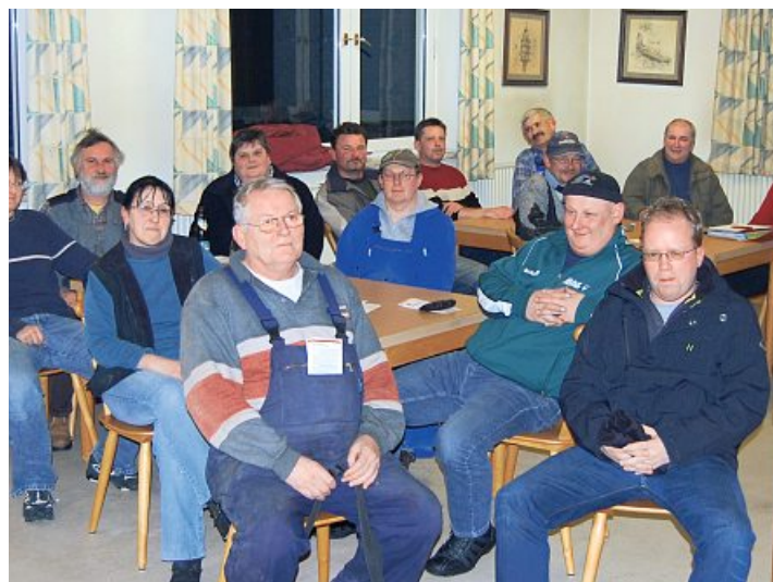
Mitgliederversammlung der Firma Grünwald

Als weiteres positives Ergebnis konnte die vom Unternehmen