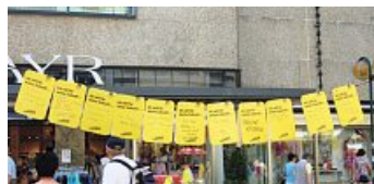
Wünsche der Jugend für die Zukunft