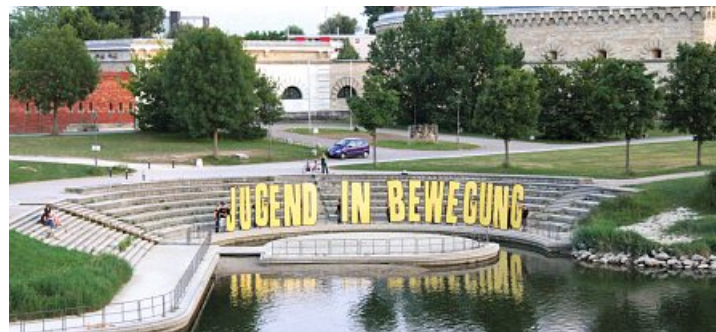
Aktion des OJA der IG Metall an der Donaubühne: Über den jüngsten Tarifabschluss hinaus bessere Bedingungen in den Betrieben erreichen.

Ortsjugendausschuss macht mit Aktion an der Donaubühne auf ihr Anliegen aufmerksam.