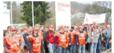
400 Arbeitnehmer im Warnstreik am 7. November bei Osram in Eichstätt.