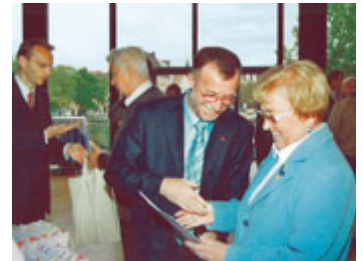
Persönlicher Dank den treuen Mitgliedern.

seiner Ansprache. »Gewerkschafter stehen für Solidarität und Gerechtigkeit durch Chancengleichheit.« Schallmeyer sparte auch nicht mit Kritik an der Bundesregierung: »Wir werden uns mit der Rente mit 67 nicht abfinden. Warum sollen die Menschen im Alter länger arbeiten, wenn vier Millionen überhaupt nicht arbeiten dürfen.« »Eine gelungenes und würdevolles Fest«, freut sich ein Jubilar über die schönen Stunden. ■