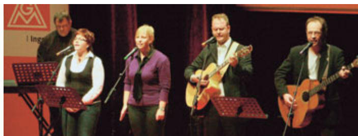
Die IG Metall-Musikgruppe StehGreif musiziert für die Jubilare.