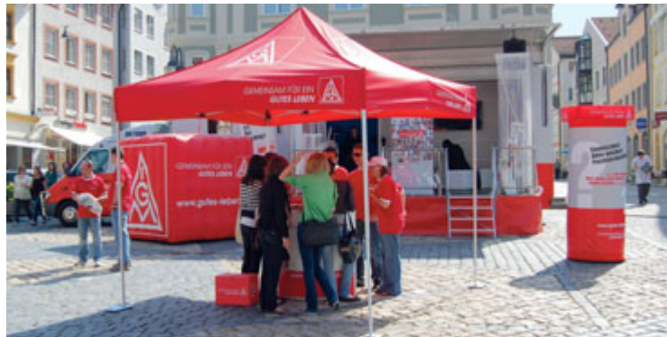
Eichstätter Bürger formulieren ihre Ansprüche an die Politik.