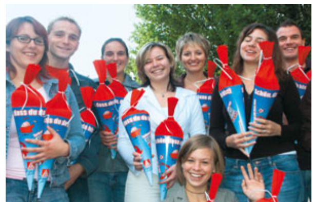
Kleine Tüte – großer Inhalt.

»Die Eintritte der jungen Kolleginnen und Kollegen machen diejenigen mundtot, die behaupten, den Gewerkschaften laufen die Mitglieder davon. Im Gegenteil, mit über 5000 Mitgliedern unter 27 Jahren sind wir Ingolstädter die jüngste Verwaltungsstelle in der Bundesrepublik«,