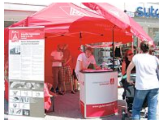
Aktionszelt der Fa. Schaeffler Technologies GmbH & Co. KG