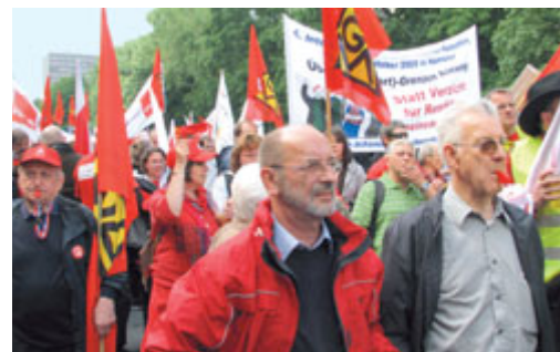
Ingolstädter demonstrieren in Berlin für einen europäischen Sozialpakt.

»Wenn nicht energisch gehandelt wird gegen Krise und Krisenverursacher, dann wird das Folgen haben für Demokratie und sozialen Frieden«, warnte der DGB-Vorsitzende. Dazu gehöre auch, dass die Opfer der Krise nicht noch die Kosten der Krise tragen dürften. »Die Verursacher müssen zahlen«, rief Sommer unter Beifall der Demonstranten.