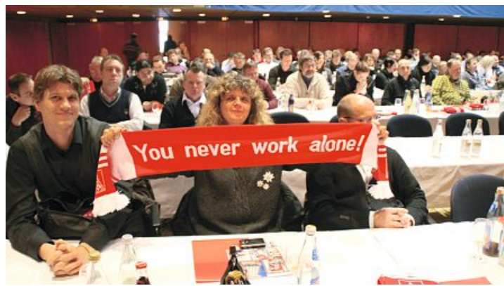
Gemeinsam für einen Kurswechsel in der Modellregion Ingolstadt.

Zukunft der Arbeit, Demokratie, Migration oder demografische Entwicklung sind Unterthemen. Genauso wie die Stadtent-