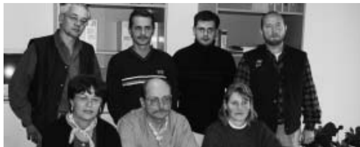
Das Betriebsratsgremium von Elektrometall ist für die Beschäftigten in der Manchinger Straße und im GVZ zuständig

Den Auftakt bilden vom 1. März bis 30. Mai die Betriebsratswahlen. In Ingolstadt beginnen die Wahlen in rund 60 Unternehmen der Metall-, Elektro-, Textil- und Holzbranche. Rund 300 Betriebsräte sind in der IG Metall organisiert. Bei der Organisation der Wahlen werden die Wahlkommissionen durch die IG Metall Ingolstadt unterstützt. In Wahlvorstandsschulungen wurden die Veränderungen in der neuen Wahlordnung vorgestellt. Für den weiteren Verlauf der Wahlen stehen sechs Sekretärin-