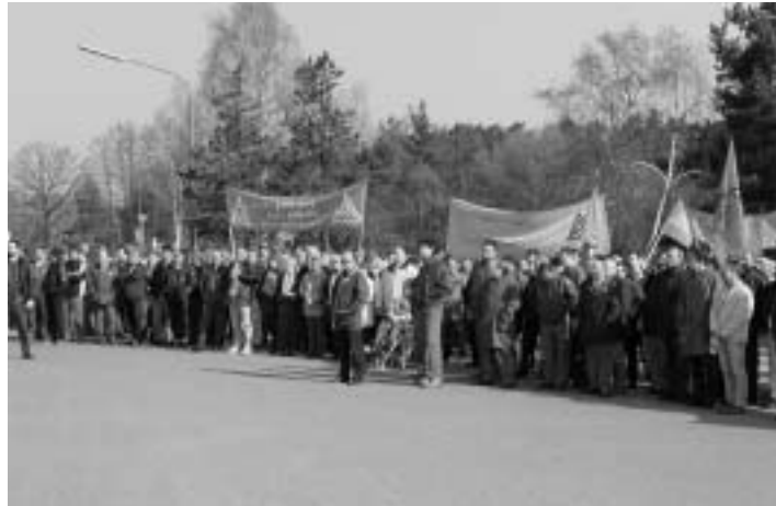
Warnstreik bei EADS in Manching