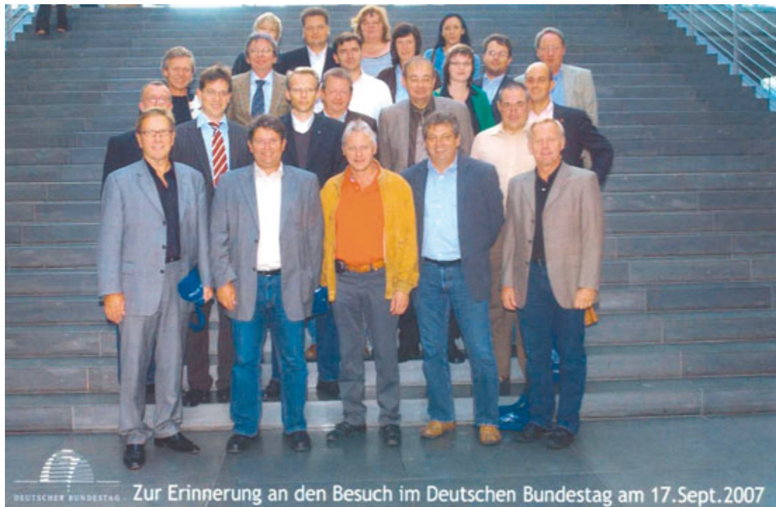
Der Ortsvorstand der IG Metall Ingolstadt informiert sich im Deutschen Bundestag.