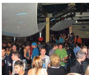
IG Metall Jugend feiert

Megaparty der IG Metall Jugend Ingolstadt.