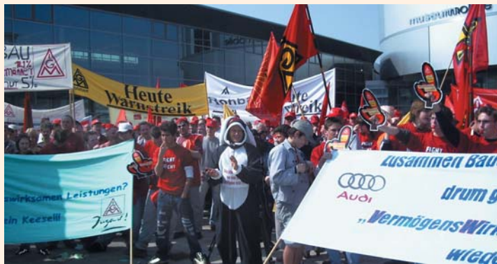
Kundgebung auf der Piazza

Der Tarifvertrag über vermögenswirksame Leistungen wurde modifiziert und kann künftig für die betriebliche Altersvorsorge genutzt werden. Das ist ein richtiger und wichtiger tarifpolitischer Beitrag zur Alterssicherung der Beschäftigten. »Auf das