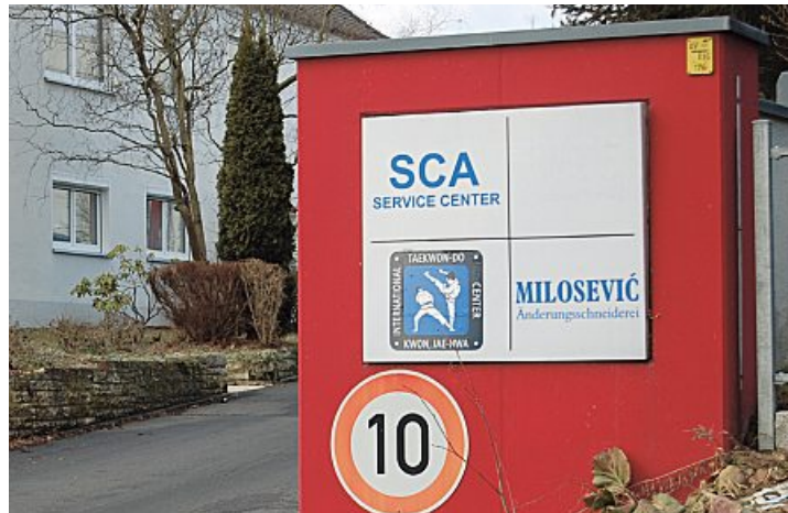
Bezahlt seinen Näherinnen geringe Löhne.

Nach dem gültigen Tarifvertrag für die Bekleidungsindustrie müssten die Arbeitnehmerinnen in die Lohngruppe 4 eingruppiert werden. Nach dem neuen Tarifabschluss hätten die Frauen einen Akkordrichtsatz (Stundenverdienst bei Normalleistung) von 10,69 Euro erhalten. Bei einer durchschnittlichen branchenüblichen Akkordleistung von 130 Prozent hätten die Näherinnen ein