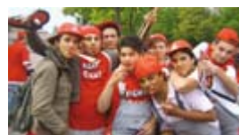
Wir sind es wert