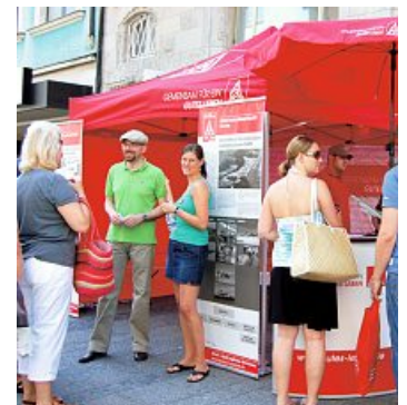
Aktionszelt der Fa. EADS Deutschland GmbH