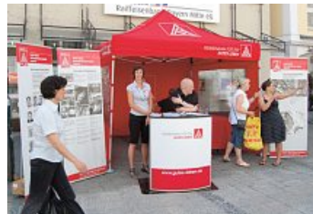
Aktionszelt der Fa. Conti Temic microelectronic GmbH Ingolstadt