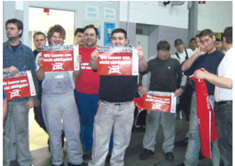
»Wir lassen uns nicht abbügeln«.

»Der Druck auf die Automobilindustrie war maßgebend für