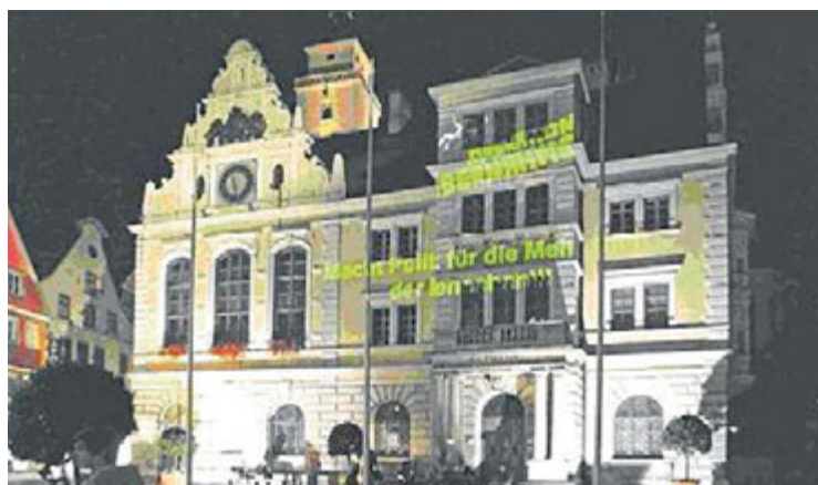
Nächtliche Aktionen in Ingolstadt