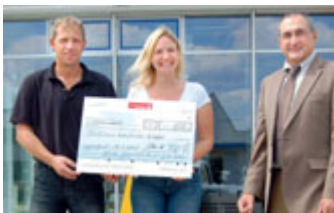
Scheckübergabe bei Wacker Neuson SE