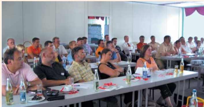
Konferenz Projekt »Gute Arbeit«

Die Unternehmen geben die »Zwänge des Marktes« immer öfter direkt an die Arbeitnehmer weiter und steigern so den Leistungsdruck. Die Beschäftigten sollen rentabilitätssteigernd und wettbewerbsorientiert arbeiten. Unternehmensrisiken werden auf sie übertragen, größere Entscheidungsspielräume erhalten sie nur dann, wenn es dem je-