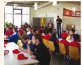
Die sehr vielen Aktionen auch in der Ingolstädter Region brachten den sehr guten Tarifabschluss: »Plus ist Muss« wurde energisch umgesetzt