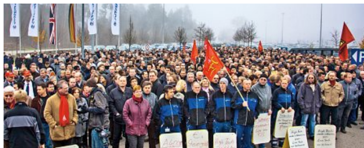
Die Beschäftigten von Cassidian in Manching wehren sich gegen die Sparbeschlüsse der Bundesregierung.

Metaller protestieren gegen die Sparbeschlüsse der Bundesregierung. »Ja zu einer gerechten Verteilung der Lasten! Nein zum Sparpaket der schwarz-gelben Bundesregierung!« Dies sind Hauptforderungen bundesweiter Protestaktionen.