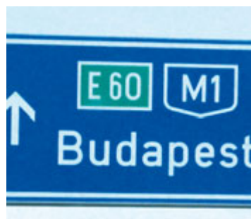
Hier geht's nach Ungarn.

Projekt »U&I« – Jugendaustausch zwischen Ungarn und Ingolstadt.