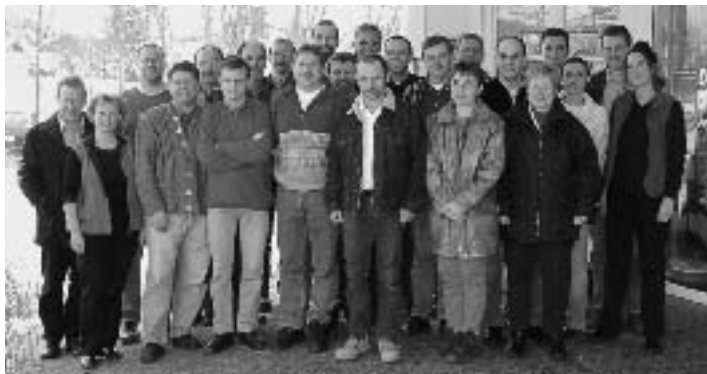
Die Teilnehmer der ERA-Schulung

ERA soll die unsinnige Trennung zwischen Arbeitern und Angestellten bei der Bewertung der Arbeit aufheben. Deshalb entwickeln Arbeitgeber und IG Metall in zähen Verhandlungen ein völlig neues System der Entgeltgruppen. Ein entscheidender Knackpunkt bei diesen Verhandlungen ist die Frage, ob die Ausbildung oder die tatsächlich geleistete Arbeit das entscheidende Kriterium für das Entgelt ist. Letzteres fordert die IG Metall und verspricht sich davon eine hohe Durchlässigkeit zwischen