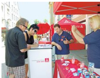
Aktionszelt der Fa. Osram mit Passanten beim Lösen des Kreuzworträtsels