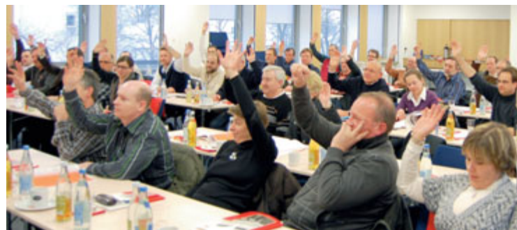
»SwIng«-Betriebsräte stimmen für einen Schutzschirm für die Beschäftigten.

Unser Gegenentwurf zu einer Politik für Aktionäre, Finanzjongleure und Banker.