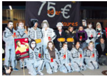
4000 Kolleginnen und Kollegen aus der Nachtschicht im Warnstreik zum Auftakt der Tarifrunde bei Audi: Die Jugend glänzte mit einer Aktion ganz im Zeichen von Halloween.

An den Warnstreiks in Ingolstadt und Umgebung beteiligten sich bis Anfang November rund 15 500 Beschäftigte aus sieben Betrieben mit Aktionen, um die berechtigte Forderung der Metallerrinnen und Metaller zu bekräftigen.