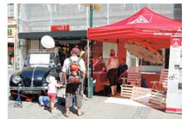
Die Handwerker wiesen an ihrem Aktionszelt auf die Wichtigkeit des Tarifvertrages hin