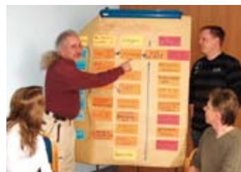
Aktive Vertrauensleute bei Audi

Aktiv sein, das wollen die Teilnehmerinnen und Teilnehmer des IG Metall Seminars »ArbeitnehmerInnen in Betrieb, Wirtschaft und Gesellschaft« der Verwaltungsstelle Ingolstadt.