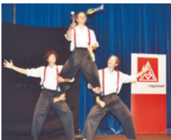
Gute Unterhaltung bei den Jubilaren mit den Jongleuren »Masters of Disaster«.