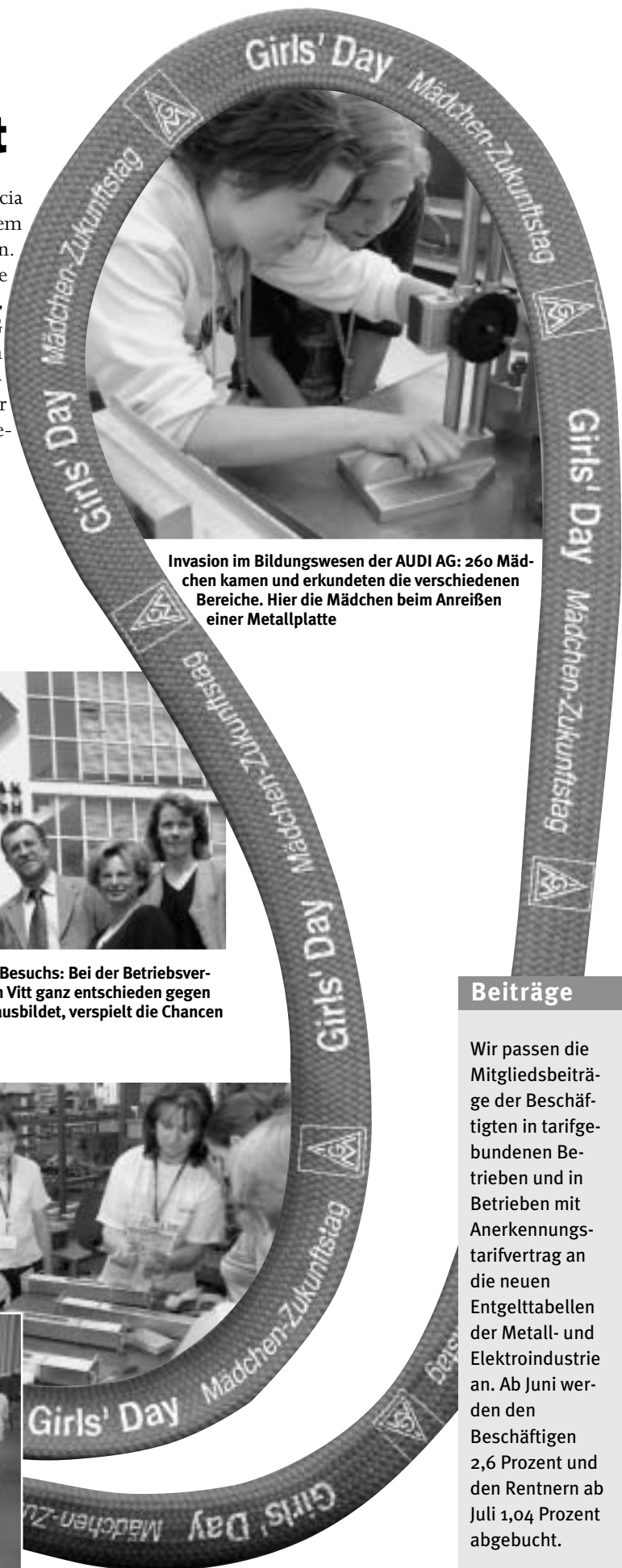
Invasion im Bildungswesen der AUDI AG: 260 Mädchen kamen und erkundeten die verschiedenen Bereiche. Hier die Mädchen beim Anreißen einer Metallplatte