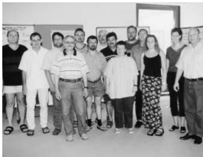
Szene des Mitgliederwerbeseminars

auch unsere Seminare zur Mitgliederwerbung. Das letzte war Ende Juli parallel zum Seminar der Senioren in Lohr.