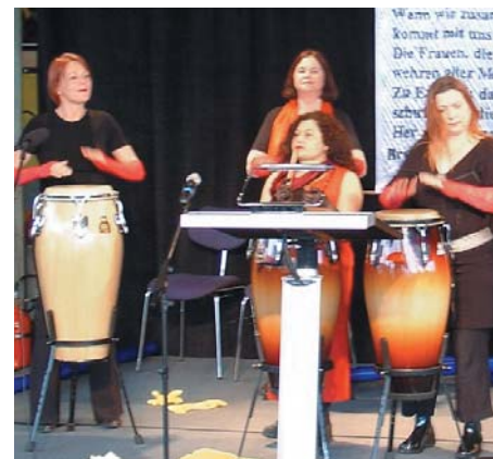
Trommeln zum Auftakt

Die »improSchow Chamäleon« und die Gruppe »Ah! Capella CmpH« aus Schrobenhausen übernahmen den humorvollen sowie musikalischen Teil. Für das leibliche Wohl sorgte der Bäuerinnenbackservice. ◀