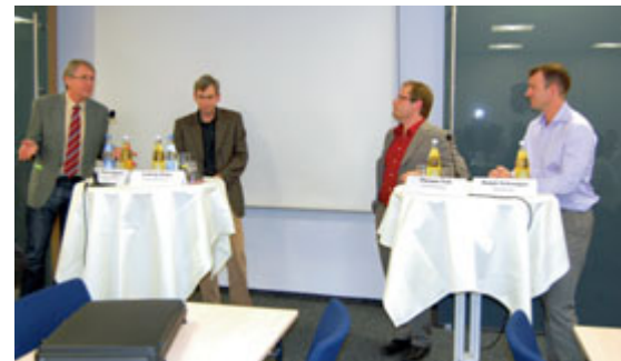
Expertengespräch zum Thema Burnout.