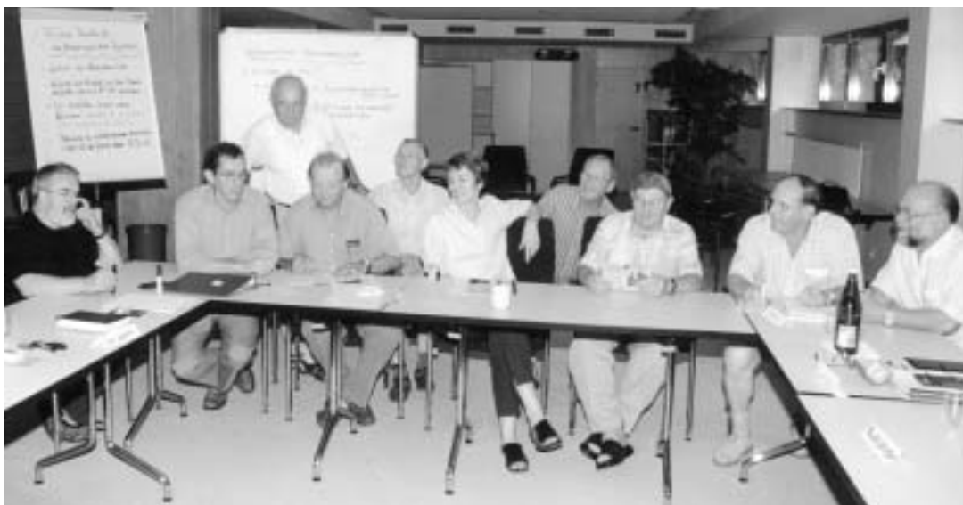
Szene des Seniorenseminars

In jedem Quartal verliert die IG Metall Ingolstadt rund 250 Mitglieder durch Austritte.