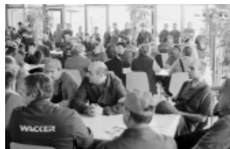
Erfolgreich gekämpft: Warnstreik bei Wacker

In dieser Tarifrunde soll nicht nur über die Entgelthöhe, sondern auch der Entgelttarifvertrag (ERA), der Tarifvertrag Bildung im Tarifvertrag (BIT) und über die Verlängerung des Altersteilzeittarifvertrags verhandelt werden.