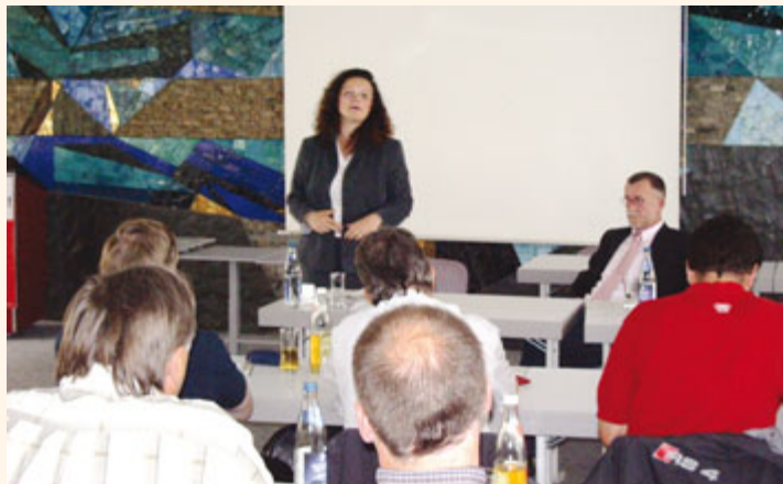
Andrea Nahles, Stellvertretende Vorsitzende der SPD, diskutiert mit Vertrauensleuten über die aktuelle Regierungspolitik