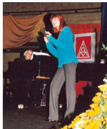
Katja Ebstein – mal witzig, mal nachdenklich.

Katja Ebstein singt und rezitiert Heinrich Heine bei der Jubilarfeier in Ingolstadt.