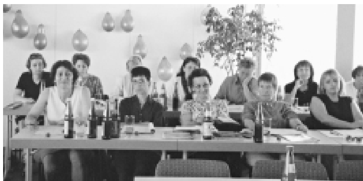
Aufmerksame Teilnehmerinnen der Frauenkonferenz in Ingolstadt

dern notwendig, um Chancengleichheit im Betrieb herzustellen.