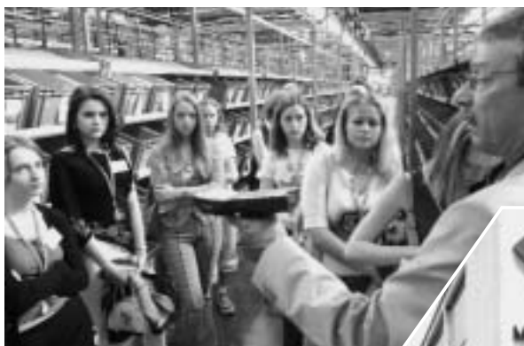
Im GVZ gab es zum Girls' Day eine Kooperation zwischen den Firmen Dräxlmaier und Faurecia. Auf dem Foto die Mädchen beim Rundgang mit dem Betriebsleiter von Dräxlmaier