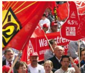
Entschlossen in die Tarifrunde

Für die Auszubildenden in Bayern wurde ebenfalls eine Erhöhung der Vergütung um 4,1