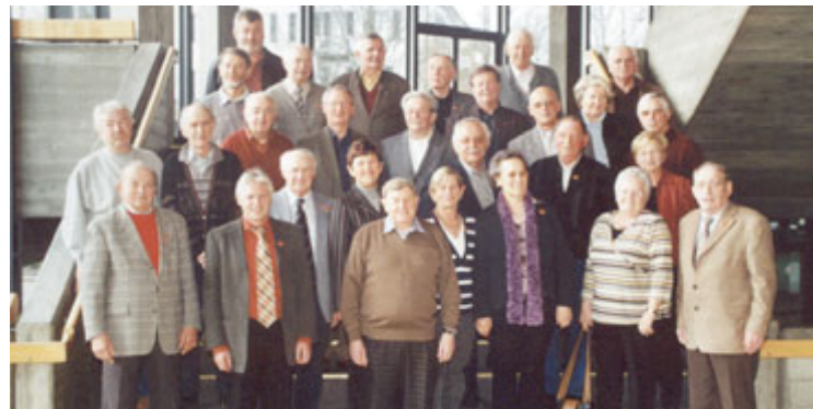
Aktive Senioren: Sie wählten ihre Vertreter für die nächste Amtsperiode.