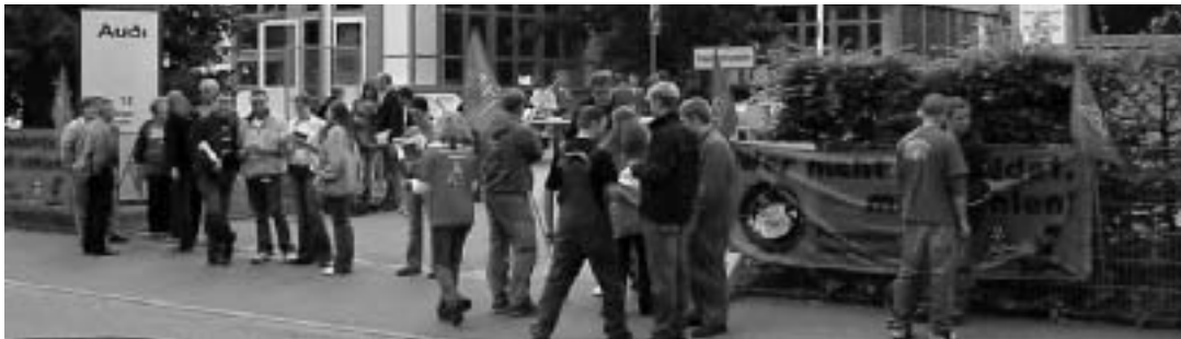
Jugendliche verteilen vor den Toren des Audi-Bildungswesens Flugblätter