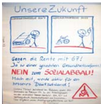
Aktiv sein: Nein zum Sozialabbau

Die Eingriffe in das Gesundheitswesen, verlängern des Rentenalters und die Steuererhöhung wurden untersucht, kritisch hinterfragt und nach Alternativen gesucht. In diesem Zusammenhang entstand ein Plakat (siehe Bild) in einer Arbeitsgruppe.