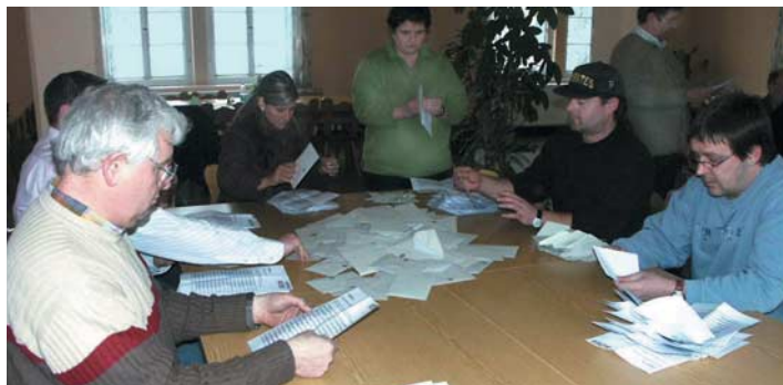
Hohe Beteiligung bei Betriebsratswahl: 77,23 Prozent stimmten ab

Die übliche Amtszeit von vier Jahren wird der Rieterbetriebsrat nicht einhalten können. Die Firmenleitung hat bereits 2005 angekündigt, zum 1. April 2006 das