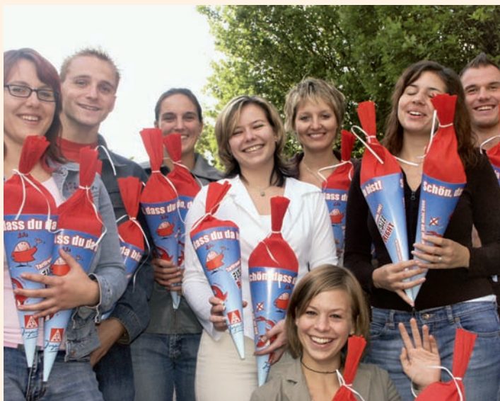
Kleine Tüte – großer Inhalt

Mit 5200 Mitgliedern unter 27 Jahren ist Ingolstadt die »jüngste Verwaltungsstelle« in der Bundesrepublik.