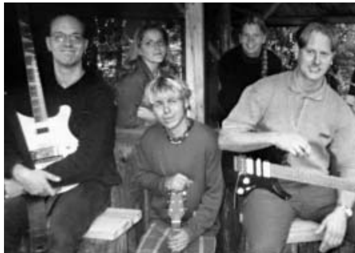
Die gewerkschaftliche Songgruppe: »IG Metall Freaks«