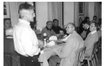
Senioren aus Gera und Ingolstadt

eine große Rolle. Beim Betriebsbesuch in der Firma A. v. Kaick diskutierten sie mit dem Betriebsrat und der Werksleitung.