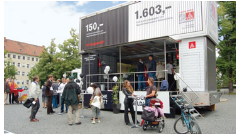
Rege Diskussion am Paradeplatz.