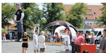
Aktion Gemeinsam für ein gutes Leben am Aktionszelt der Verwaltungsstelle