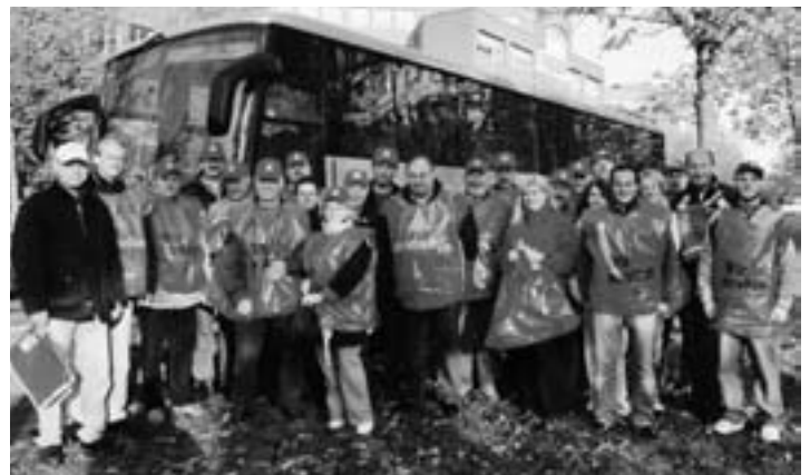
Ingolstädter Metallerinnen und Metaller unterstützten solidarisch die streikenden Kolleginnen und Kollegen bei Infinion in München

Allen Kolleginnen und Kollegen wünscht das Team der Verwaltungsstelle ein frohes und besinnliches Weihnachtsfest und einen guten Start ins neue Jahr.