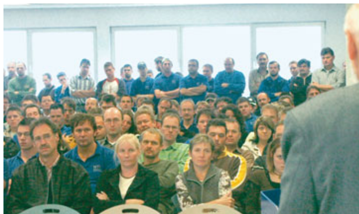
Die Kolleginnen und Kollegen bei Misslbeck haben die Nase voll und wollen faire Bedingungen im Tarifvertrag.