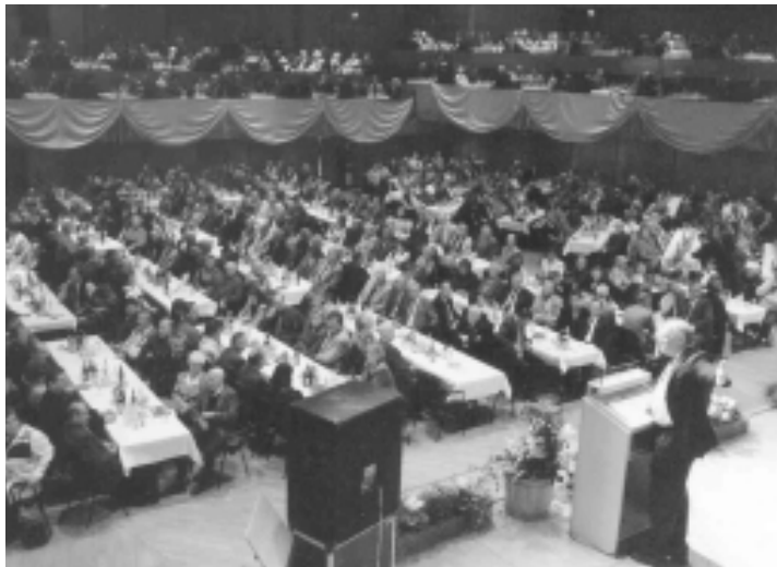
Voller Saal bei der Jubilarfeier: Dank für lange Treue

Mitgliedschaft. 78 Kolleginnen und Kollegen konnten für 50 und 399 für 40 Jahre Mitgliedschaft ausgezeichnet werden. 25 Jahre mit dabei waren 583 Kolleginnen und Kollegen.