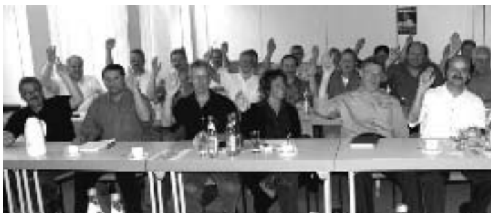
Einstimmig wurde die Resolution verabschiedet

»Wir brauchen mehr Zusammenarbeit der Betriebsräte in dieser Branche sowie mehr Innovation und Kooperation der Unternehmen« lautete der Kern der beschlossenen Resolution.