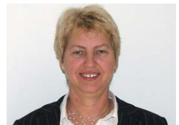
Die frischgebackene Betriebsratsvorsitzende

Wir wünschen unseren Mitgliedern ein friedliches Weihnachtsfest und ein frohes Neues Jahr 2007.