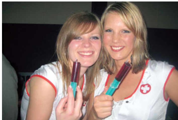
Kühle Getränke aus Spritzen gab es auf der Party zur Operation Übernahme.