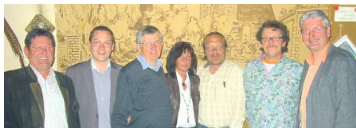
Die Betriebsräte von FM-Systems, BO-Systems, und der Rieter GmbH. Gemeinsames Ziel der Betriebsräte: Rieter bleibt Entwicklungs- und Montagestandort.