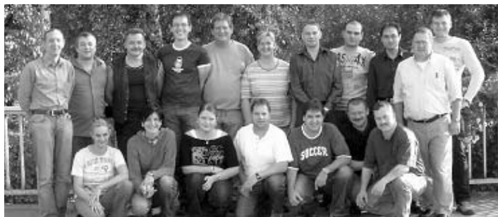
Vertrauensleute am A1-Seminar in Emsing

Die Diskussionen über Hartz IV, die Rentenreform und die Einschnitte im Gesundheitswesen waren, so die einhellige Meinung aller Teilnehmer, informativ und aufschlussreich. Geprägt von den verschiedenen Nachrichtenendungen und Schlagzeilen in den Zeitungen haben sie