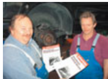
Die Kollegen protestieren gegen die Tarifkündigung

Die IG Metall protestierte bereits im Dezember mit einer Flugblattaktion vor den Ingolstädter Kfz-Betrieben.