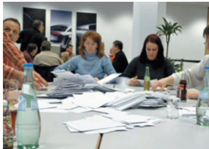
Auszählung der Betriebsratswahl bei Audi