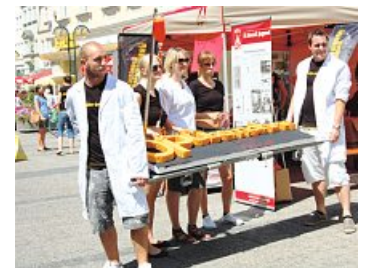
Jugend in Aktion