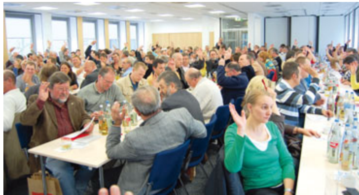
Die Delegierten stimmen über die Politik der IG Metall Ingolstadt ab.

»Deutlicher kann die Anerkennung für die gute Arbeit unserer Betriebsräte kaum ausfallen«, bewertet Stiedl die Wahlergebnisse. ■