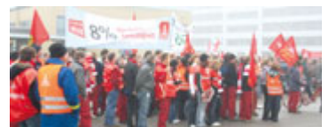
Ganz unter dem Motto »Wer nicht zahlen will, muss fühlen« stand der Warnstreik bei der EADS in Manching.