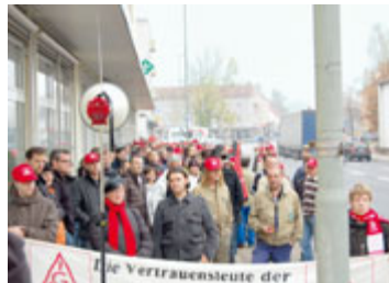
Gemeinsame Warnstreikaktion von Conti Temic und Schaeffler.