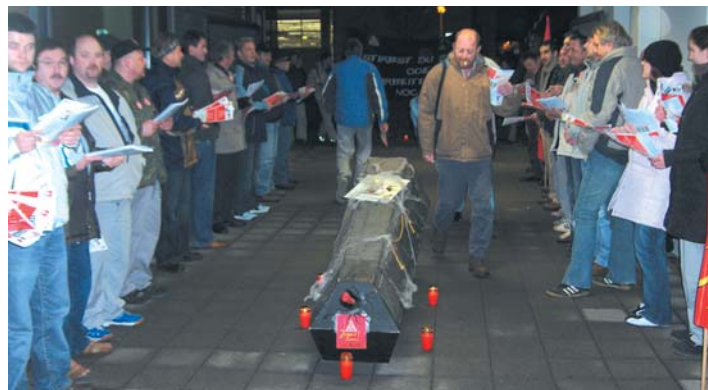
Mehr als 30 000 Audi-Beschäftigte protestieren während der Arbeitszeit gegen die Heraufsetzung des Rentenalters

Nur 40 Prozent der heute über 55-Jährigen sind noch erwerbstätig. 2005 waren rund ein Viertel aller Erwerbslosen 50 Jahre und älter. Sie sind hochgradig von Langzeitarbeitslosigkeit be-