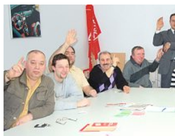
Listenaufstellung in der Mitgliederversammlung zur Betriebsratswahl bei der Firma Ideal, Ingolstadt.