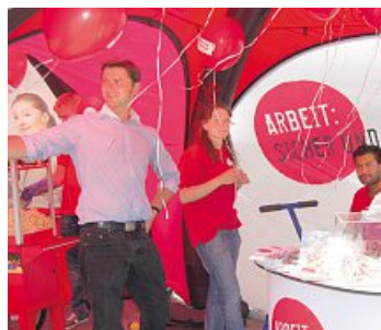
Die junge Generation macht mobil.

Die Jugend bringt ihre Kritik an unfairen Bedingungen für junge Arbeitnehmer in die Öffentlichkeit.