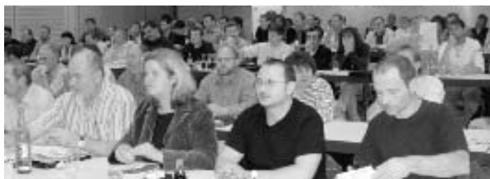
Vertrauensleutekonferenz in Deggendorf: lebhaft Diskussion

Wie wir zukünftig arbeiten und leben wollen, aber auch welche Instrumente und Hilfestellungen den Vertrauensleuten bei ihrer wichtigen Aufgabenstellung geboten werden müssen, wurde in der Vertrauensleutekonferenz lebhaft diskutiert.