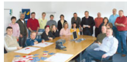
IG Metaller bei Sumitomo immer informiert.