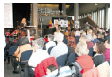
Frauentag in Ingolstadt.

Der Mix aus Politik, Information und Unterhaltung bot allen Besucherinnen und Besuchern mit ihren Familien ein kurzweiliges Programm.