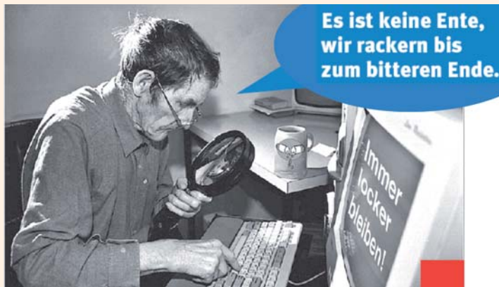
In den Betrieben ein Thema: Alters- und altersgerechtes Arbeiten

Die Beschäftigten in den Unternehmen befinden sich in einem tiefgreifenden Altersstrukturwandel. Zukünftig wird es mehr ältere Arbeitnehmer/innen geben, die länger im Berufsleben bleiben.