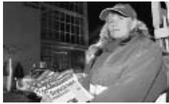
Unter dem Slogan »Wir kämpfen« protestierten INA-Beschäftigte gegen Werkschließung und Personalabbau

Seit dem Zeitpunkt, als 2001 das 1883 gegründete Traditionsunternehmen FAG vom Familienkonzern INA übernommen wurde, ist im Konzern der Wurm drin. Überrascht nahmen die Belegschaften der INA- und FAG-Standorte das rigorose und bisher nie gekannte Vorgehen der Unternehmensleitung gegen verbriefte Arbeitnehmerrechte zur Kenntnis. Fakt ist, dass diese in Verbindung mit der Ende des Jahres auslaufenden Beschäftigungssicherung wissen ließ, dass sie die geltenden Tarifverträge in der bestehenden Form nicht mehr akzeptieren will. Entsetzt und empört reagierte die Belegschaft von INA auf das Drängen der Unternehmensleitung, drei Stunden Mehrarbeit ohne Lohnausgleich von den Arbeitnehmern zu