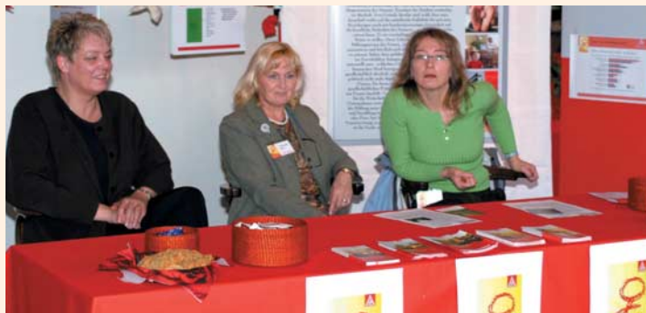
Frauentag: für die Vereinbarkeit von Beruf und Familie

Die zurückgesandten Fragebögen werden ausgewertet. Am 19. Oktober ist dann eine Konferenz mit den regionalen Unternehmen und der IG Metall im Gewerkschaftshaus geplant. Dort werden die besten betrieblichen