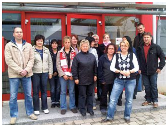
Protest bei Sumitomo gegen die Sparbeschlüsse.